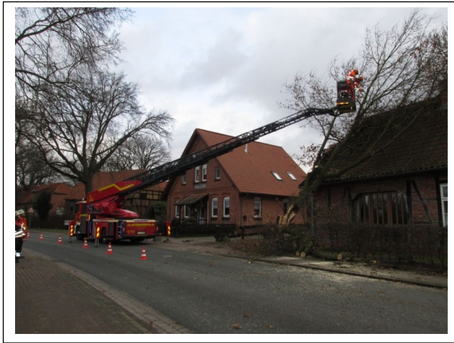
Die Drehleiter aus Liebenau trägt den Baum Stück für Stück ab