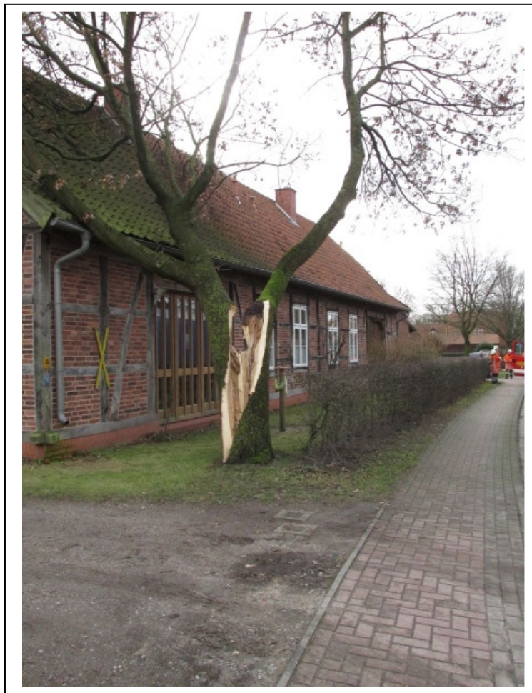
Die massive Eiche hängt auf dem Dach des Einfamilienhauses